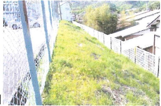
3丁目公園のノリ面草刈りカ所