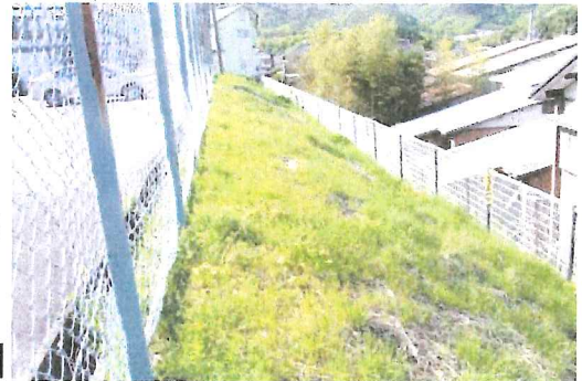
3丁目公園のノリ面草刈りカ所